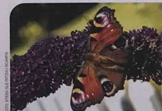
Sommerfuglen her kaldes dagpåfugleøje. I år har man kun observeret en fjerdedel af det antal dagpåfugleøjer, som man plejer.

Han mener, at der er færre sommerfugle i den danske natur, fordi der har været flere tørre somre i træk, og fordi der er blevet færre af de steder, hvor sommerfuglene kan lide at bo.