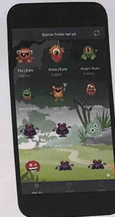
Her er nogle af trolde, man kan fange.