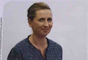
Regeringen ledes af statsminister Mette Frederiksen (Socialdemokratiet).

EU har undersøgt, hvor tilfredse EU-borgerne er med deres regerings håndtering af corona-krisen. Danskerne er sammen med irerne dem, der er mest tilfredse. 85 ud af 100 danskere siger, at de er enten 'meget tilfredse' eller 'rimeligt tilfredse' med regeringen. Indbyggerne i Spanien er dem, der er mindst tilfredse med deres regerings håndtering af corona-krisen.