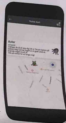
Trolde er placeret forskellige steder på Samsø.